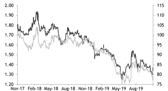
— ATP30 PCL - (LHS, THB) — ATP30 PCL / Stock Exchange of Thai Index - (RHS, %)